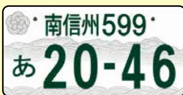
図柄入りモノクロ