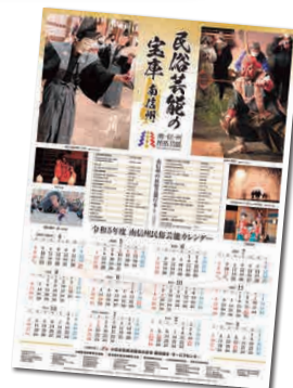
令和5年度 南信州民俗芸能カレンダー

カレンダーには一般公募により選ばれた6点の写真と、南信州地域で行われる民俗芸能行事の日程の一部を掲載しています。カレンダーは公共施設などに掲示するほか、希望者に数量限定で配布をします。希望者は南信州広域連合総務課(0265-53-7100)までお問い合わせください。