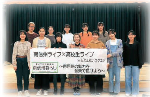
でこさん(写真前列中央)と高校生の皆さん

今後、SNS等での発信やイベント等でも活用していく予定ですので、地域内外の多くの方達に聴いていただきたいと思います。