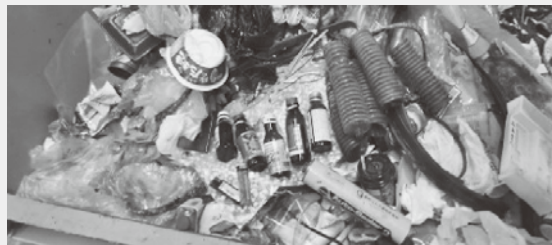
ピン、資源プラ、家電品等が混入している状態