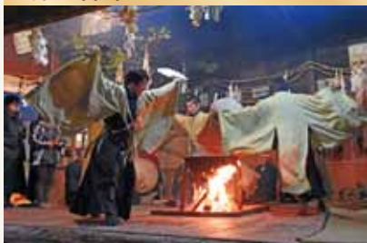
(天龍村の霜月神楽)