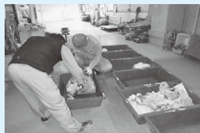
「市町村搬入ごみチェック」の様子