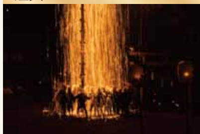
(清内路の手作り花火)