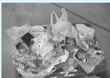
プラスチック資源