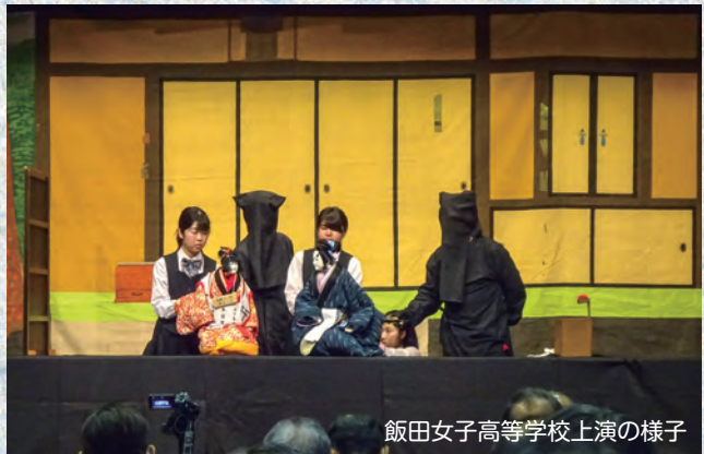
飯田女子高等学校上演の様子