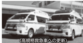
〈高規格救急車への更新〉