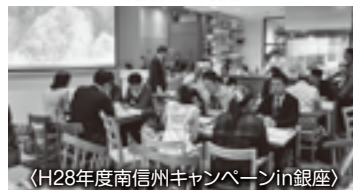
〈H28年度南信州キャンペーンin銀座〉